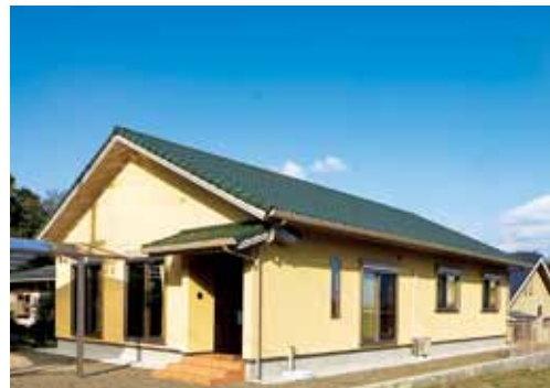
和洋モダンが融合したシンプルデザインの外観。アートコテ塗り仕上げの外壁は、夫妻の好みで明るいイメージのアイボリーカラーをチョイス。