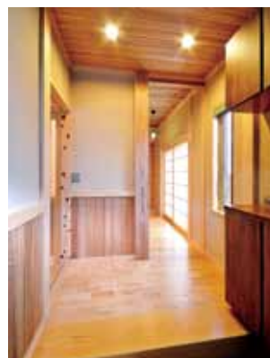
清々しい木の香漂う玄関。和室へは廊下側から直接出入りできる。