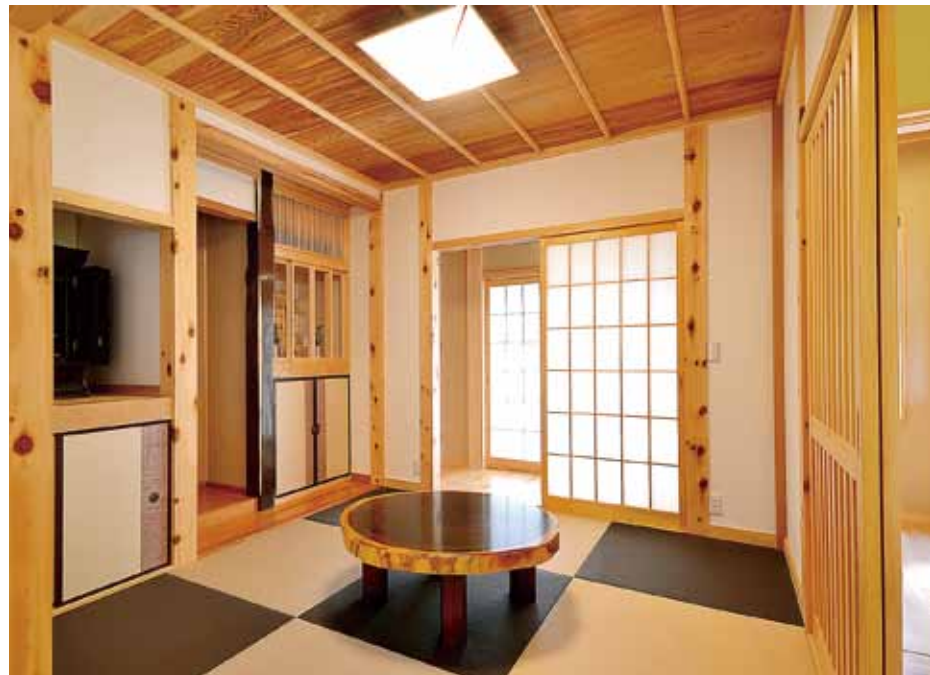
リビングとフロア続きでつながる和室。扉を閉めれば個室の客間として使うこともできる。杉板無垢の天井に白い塗り壁、節目を見せた柱や濃淡色の畳など、素材&色使いに凝った内装に注目!