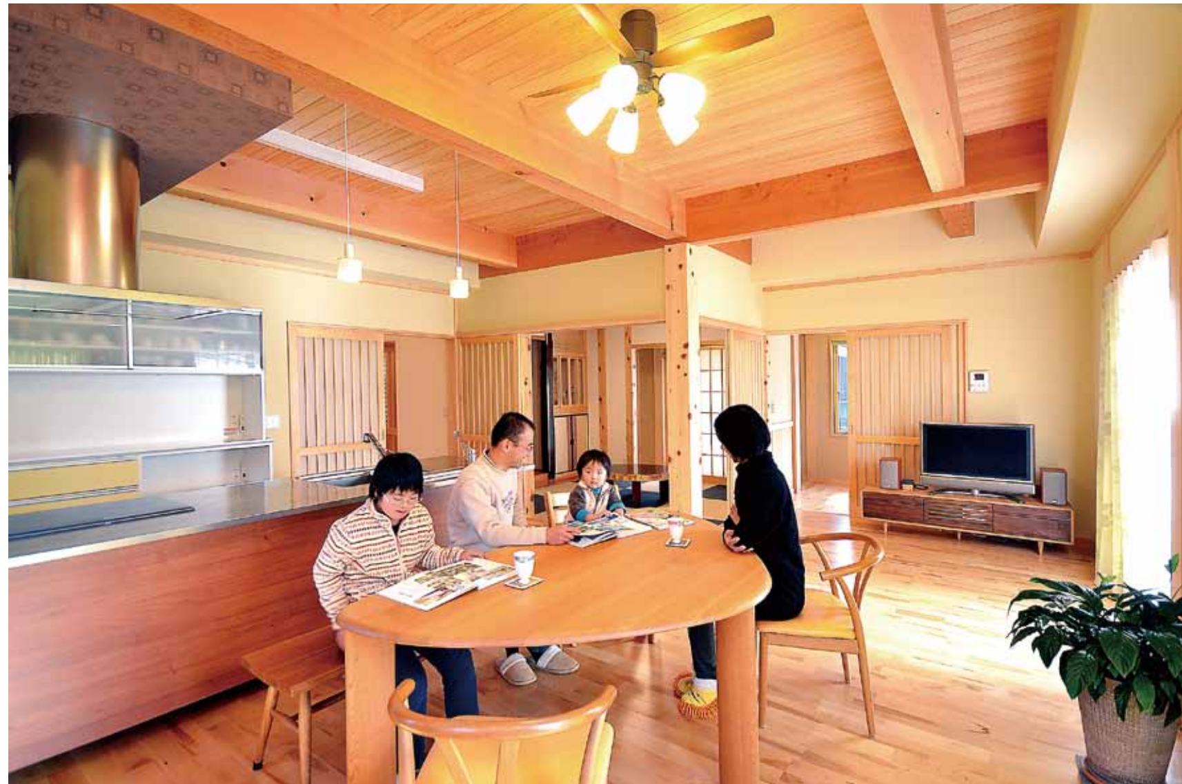
新建材は一切使わず、天然素材だけで仕上げたこだわりの住まい。土壁と木のやさしい温もりに包まれ、健康で快適な暮らしが実現。