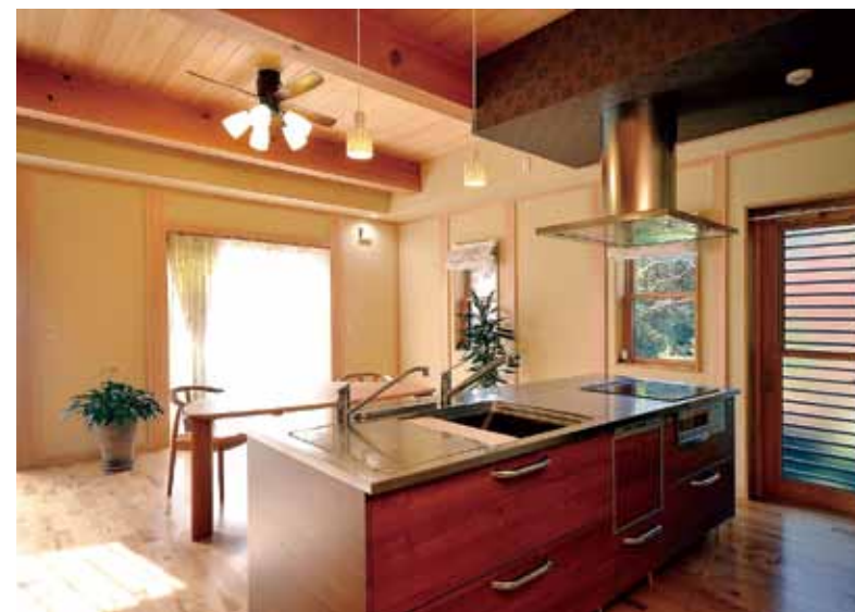
料理や食にも関心とこだわりを持つ夫妻が選んだのは、用と美を兼ね備えたアイランド型脚付きキッチン。シックなウッドパネルが空間と調和。

端正な平屋造りが目を引くT邸は、土壁と天然素材にこだわった家。手がけたのは、匠の技の家づくりで知られる「山内建匠」。竹小舞の地下作りから左官塗り、荒壁、乾燥、上塗りといった伝統手法による土壁造りに、三代にわたって受け継がれた大工ならではの技が光る。 珪藻土塗り壁と無垢材が織りなす邸内は、玄関側の前面にLDK、そして吹き抜けの中廊下をはさんだ奥側がプライベートスペースという間取り。いずれの間も、和の伝統と自然素材のよさを生かしつつ、モダンな雰囲気にも仕上がっているのが特長だ。また、省エネルギー住宅(トップランナー基準)として断熱気密性能にも優れ、一年を通して快適な住み心地を実現。「家憧れの「土壁の家」が、まさに完璧なカタチとなつてここに完成した。