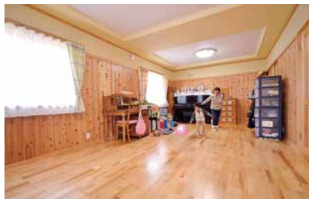
明るく広々とした子ども部屋。将来は2室に仕切れるよう設計されている。壁は珪藻土塗り、また、扉と窓の高さに合わせて張られた腰壁には杉板を使用。