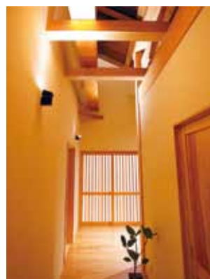
中廊下は、夜にはまた違う表情をみせる。