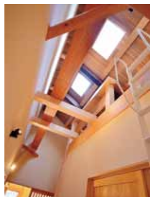
T主人の夢とこだわりが詰まったロフトスペース。

端正な平屋造りが目を引くT邸は、土壁と天然素材にこだわった家。手がけたのは、匠の技の家づくりで知られる「山内建匠」。竹小舞の地下作りから左官塗り、荒壁、乾燥、上塗りといった伝統手法による土壁造りに、三代にわたって受け継がれた大工ならではの技が光る。 珪藻土塗り壁と無垢材が織りなす邸内は、玄関側の前面にLDK、そして吹き抜けの中廊下をはさんだ奥側がプライベートスペースという間取り。いずれの間も、和の伝統と自然素材のよさを生かしつつ、モダンな雰囲気にも仕上がっているのが特長だ。また、省エネルギー住宅(トップランナー基準)として断熱気密性能にも優れ、一年を通して快適な住み心地を実現。「家憧れの「土壁の家」が、まさに完璧なカタチとなつてここに完成した。