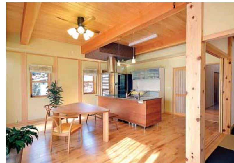
明るい色合いの珪藻土塗り壁に、檜無垢板の天井と化粧梁。床には檜無垢板を使用。シンプルモダンなインテリアコーディネートが、和洋融合のLDK空間を演出。