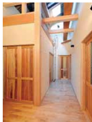
LDKと子ども部屋、主寝室を結ぶ、吹き抜けロフトのある中廊下。